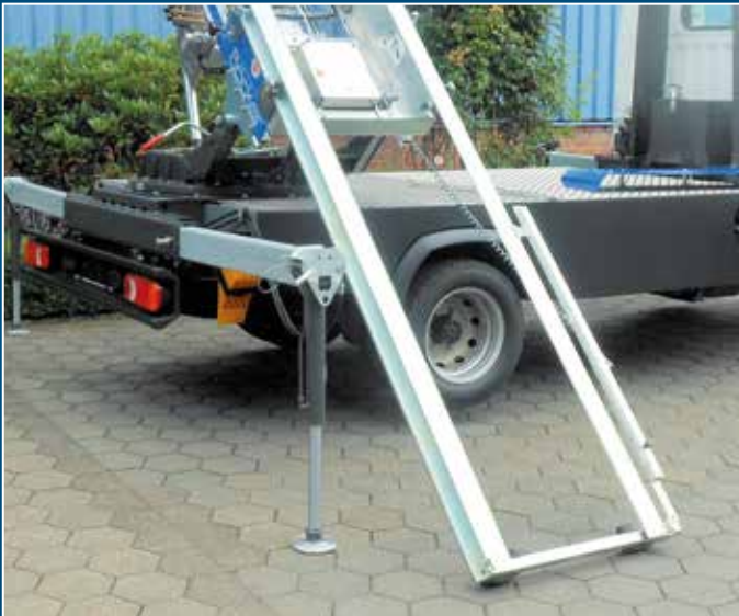
Bodentiefe Beladung möglich durch stufenlos ausziehbare untere Verlängerung