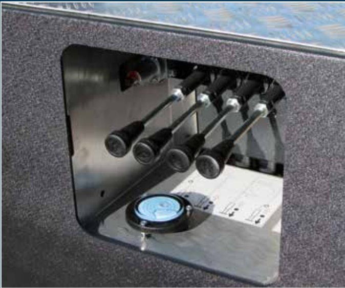
Steuerstand der hydraulischen Stützen