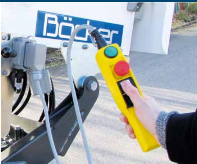
Bedienung unten über Bedienungstaster mit 4 m Kabel