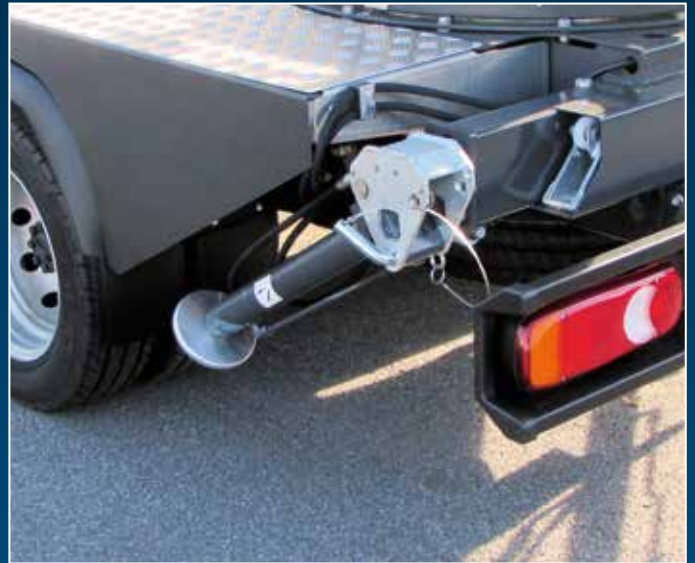
Hydraulische Stützen mechanisch ausziehbar und 60° schwenkbar