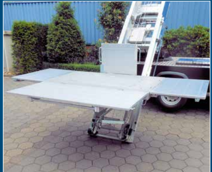
Große und ebene Beladefläche auf der Pritsche