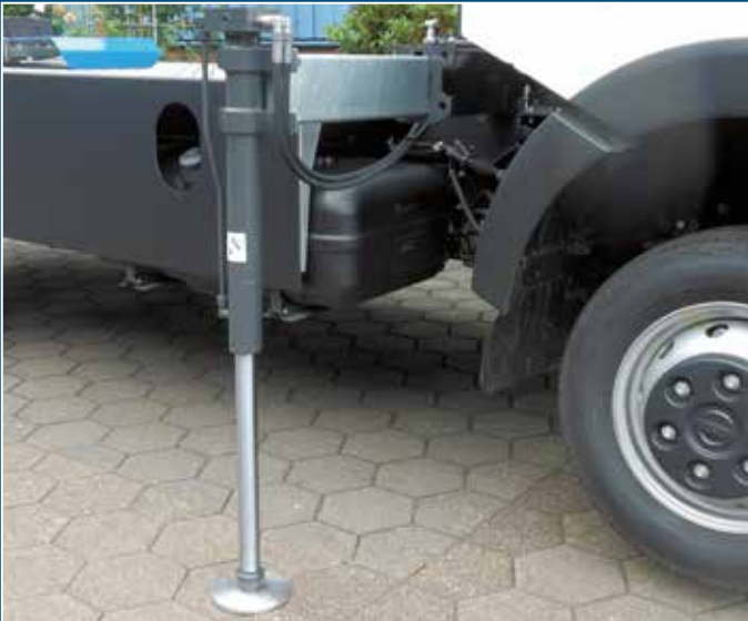
Hydraulische Stützen vorne optional ausziehbar