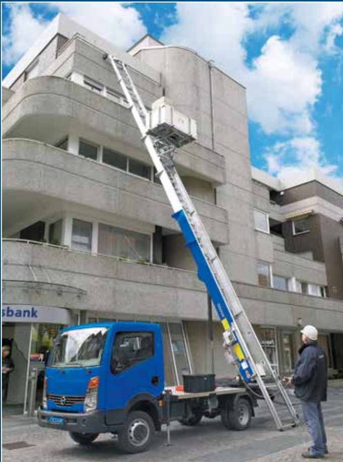
HL 26 auf 3,5 t LKW