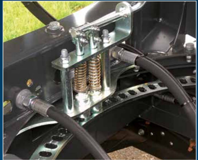
Stufenlos verstellbarer Drehkranz mit mechanisch lösbarer Sperre