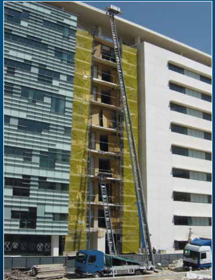
HL 42 auf 8 t LKW