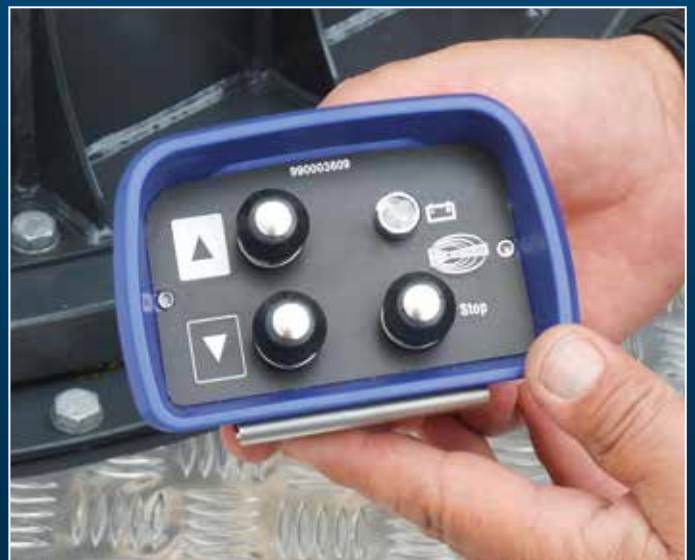
Optionale Bedienung unten über Funksteuerung