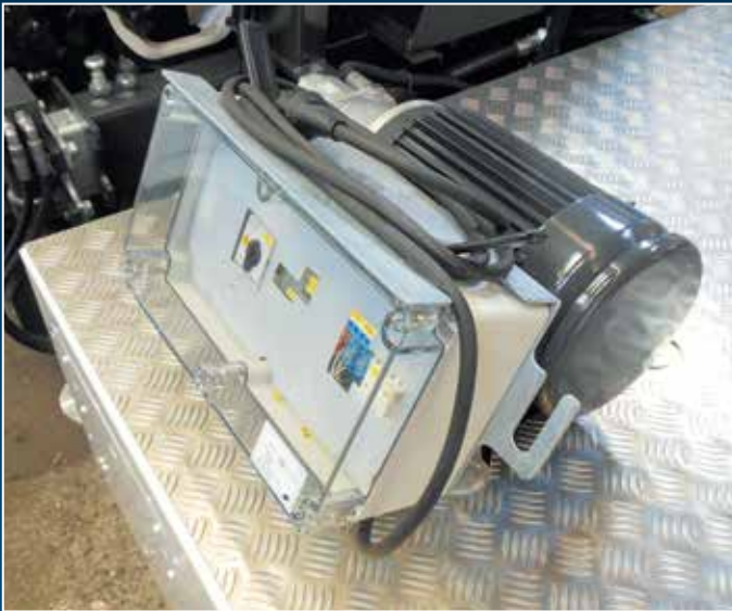
Zusätzlicher 230 Volt E-Motor (optional)