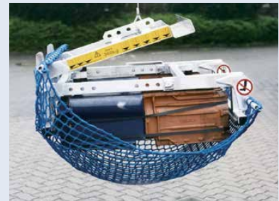
Alu-Multiziegelzange MZZ 2-360