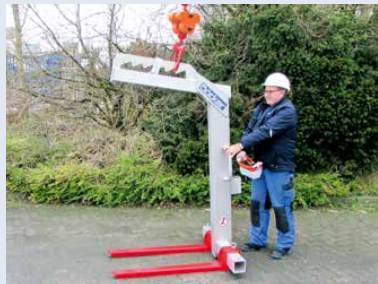
Alu-Palettengabel PG 1800 A