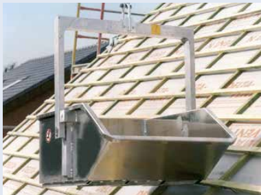
Alu-Kippmulde KM 500/315